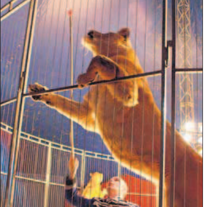
So nah kann man bei Althoff den Wildkatzen kommen.