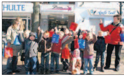
Die Straberger Vorschulkinder hatten am Mittwoch lesant einen „Good-Hair-Day“.